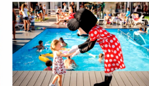
Bogaty program animacji