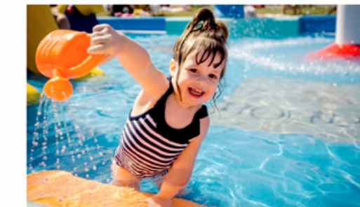
Brodziki dla dzieci